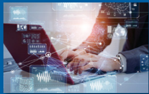
※各拠点により対応が異なる場合がございます。